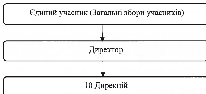
Рис.1 Спрощена організаційна структура.

Спрощена організаційна структура наведена нижче в рисунку 1.